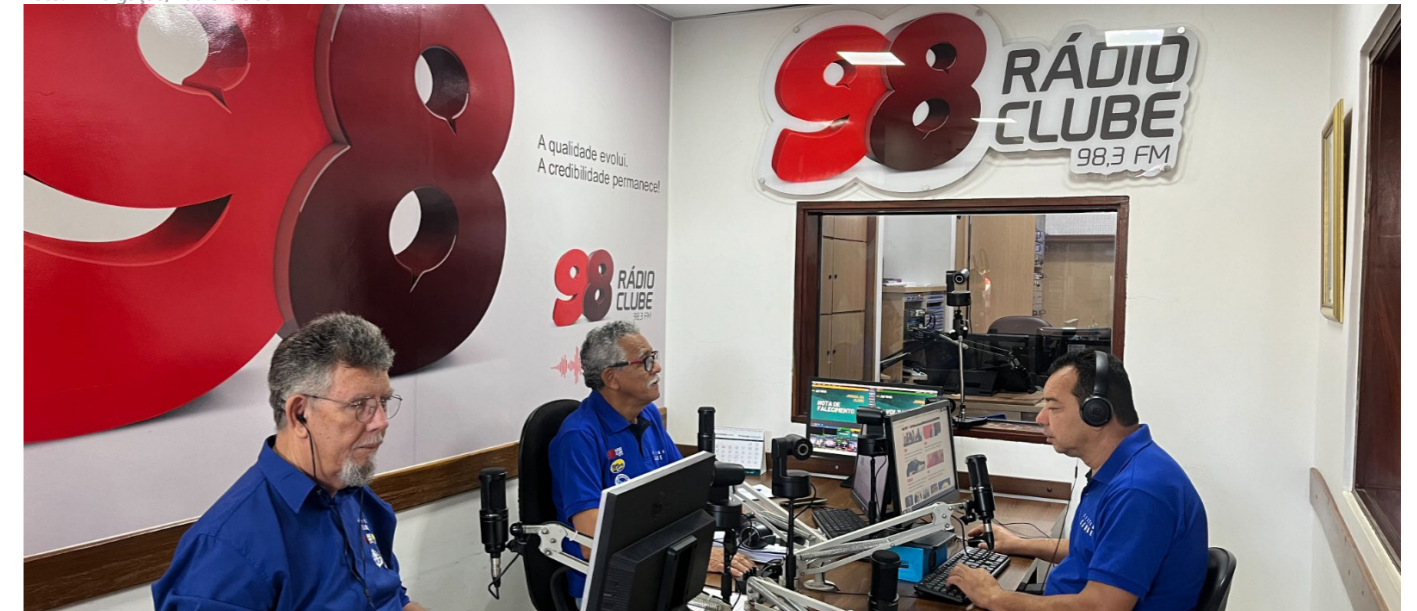
Locutores no estúdio da Radio Clube