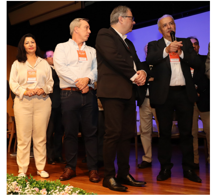
Diretoria da AMIRT

O Inovamídia, realizado no maior museu a céu aberto do mundo, reuniu cerca de 250 profissionais da comunicação, com representantes de agências de publicidade, do governo do estado, da Anatel, de associações de radiodifusão e radiodifusores, e consolidou a relevância do rádio e da televisão, mesmo na era digital em que vivemos.