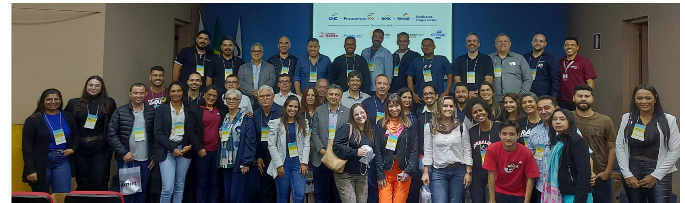
18º Encontro Regional em São João del-Rei

A realização desse tipo de evento reforça o compromisso da Associação em promover o desenvolvimento profissional e estimular a inovação no setor de comunicação, contribuindo para o crescimento e a sustentabilidade do mercado mineiro.