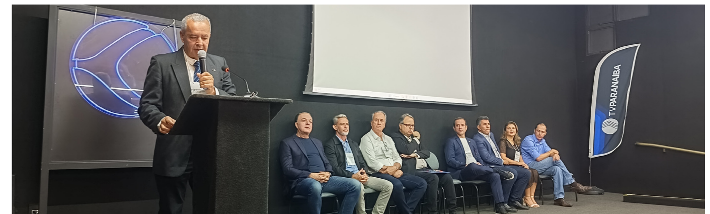
Presidente da AMIRT no 19º Encontro Regional