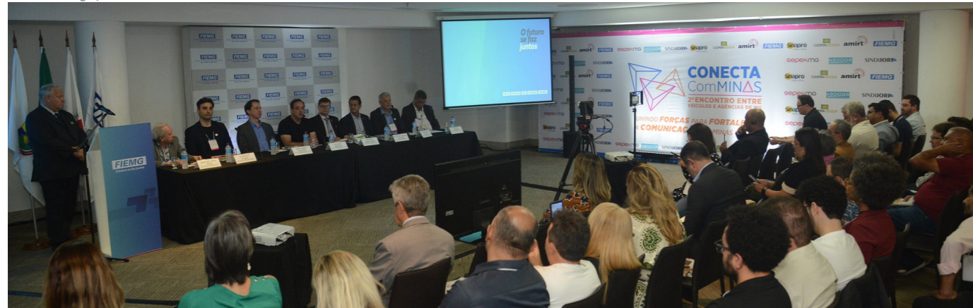
O evento reuniu cerca de 200 representantes de veículos de mídia

O 2º Conecta Com Minas, realizado no dia 21 de outubro, na sede da FIEMG, em Belo Horizonte, reuniu empresários, parlamentares, agências de publicidade e outros profissionais da comunicação para debater temas relevantes para o setor, como o impacto dos avanços tecnológicos, novas perspectivas para o mercado publicitário mineiro e valorização das empresas do estado.