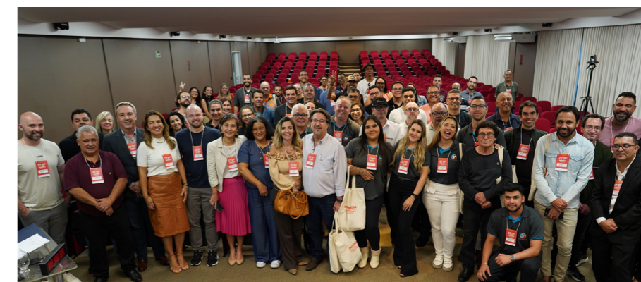
O encontro teve palestra com temas variados, como adaptabilidade do rádio e estratégias para boa uma comunicação